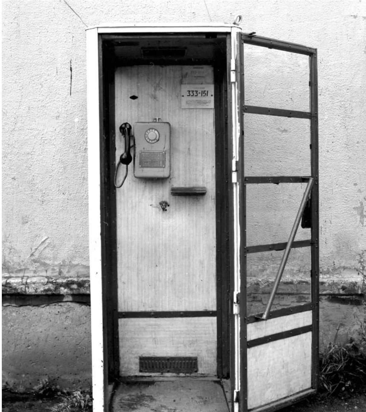
Телефонная будка, из которой велись переговоры.

Если человек снимает всякую ерунду, а потом запикивает в Photoshop, это ужас. Фотографии учатся постепенно: начинаешь с пленки, со среднеформатной камеры; смотришь не на уровне глаз, а сверху вниз; у тебя есть большой видоскатель, ты обрамляешь выбранный кусок окружающего мира, танцую вокруг объекта и прищелкивая языком. Если фотограф начал с этого, а потом осторожно перешел к Photoshop, это полезная штука. Как акриловые краски, которые появились у моего брата-художника.